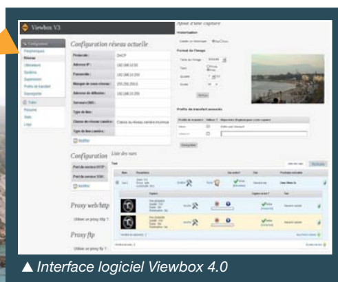
▲ Interface logiciel Viewbox 4.0