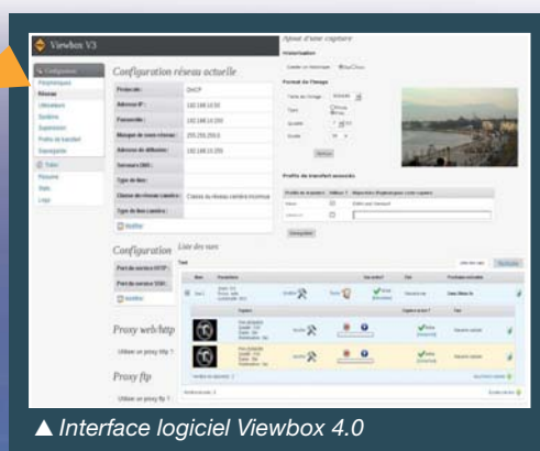
▲ Interface logiciel Viewbox 4.0